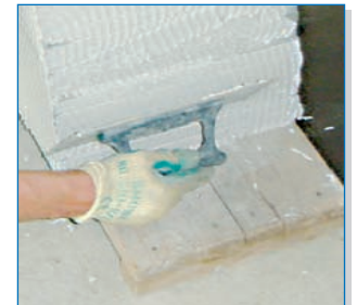
Variante 2: Kleber mit 8 mm Zahnpachtel an Estrichplattenstapel antragen (Kleberverbrauch ca. 0,3 kg/m 2 )