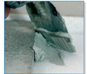
Variante 1: Kleber mit kleiner Kelle an die Estrichplatte antragen (Kleberverbrauch ca. 0,6 kg/m 2 )

Die nächste Platte wird nun durch anschieben verlegt. Beim andrücken der Platte drückt sich Kleber nach oben heraus, diesen mit der Kelle aufnehmen und weiterverarbeiten.